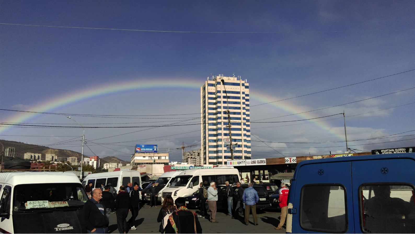
დიდუბის ავტოსადგური, თბილისი, საქართველო.